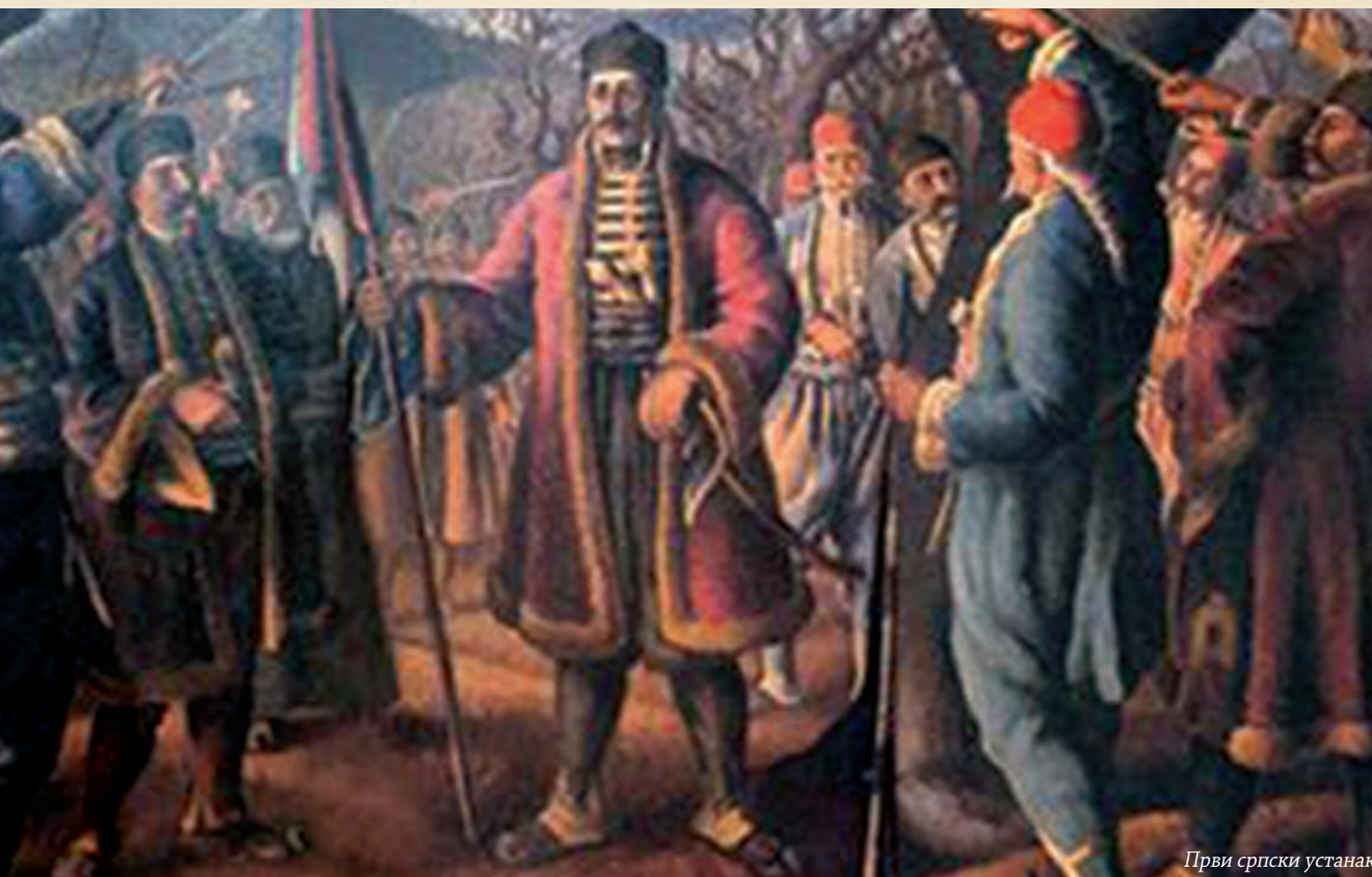
Први српски устанак