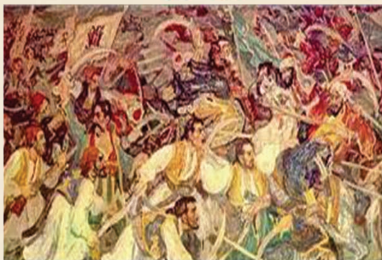
Битка на Чегру