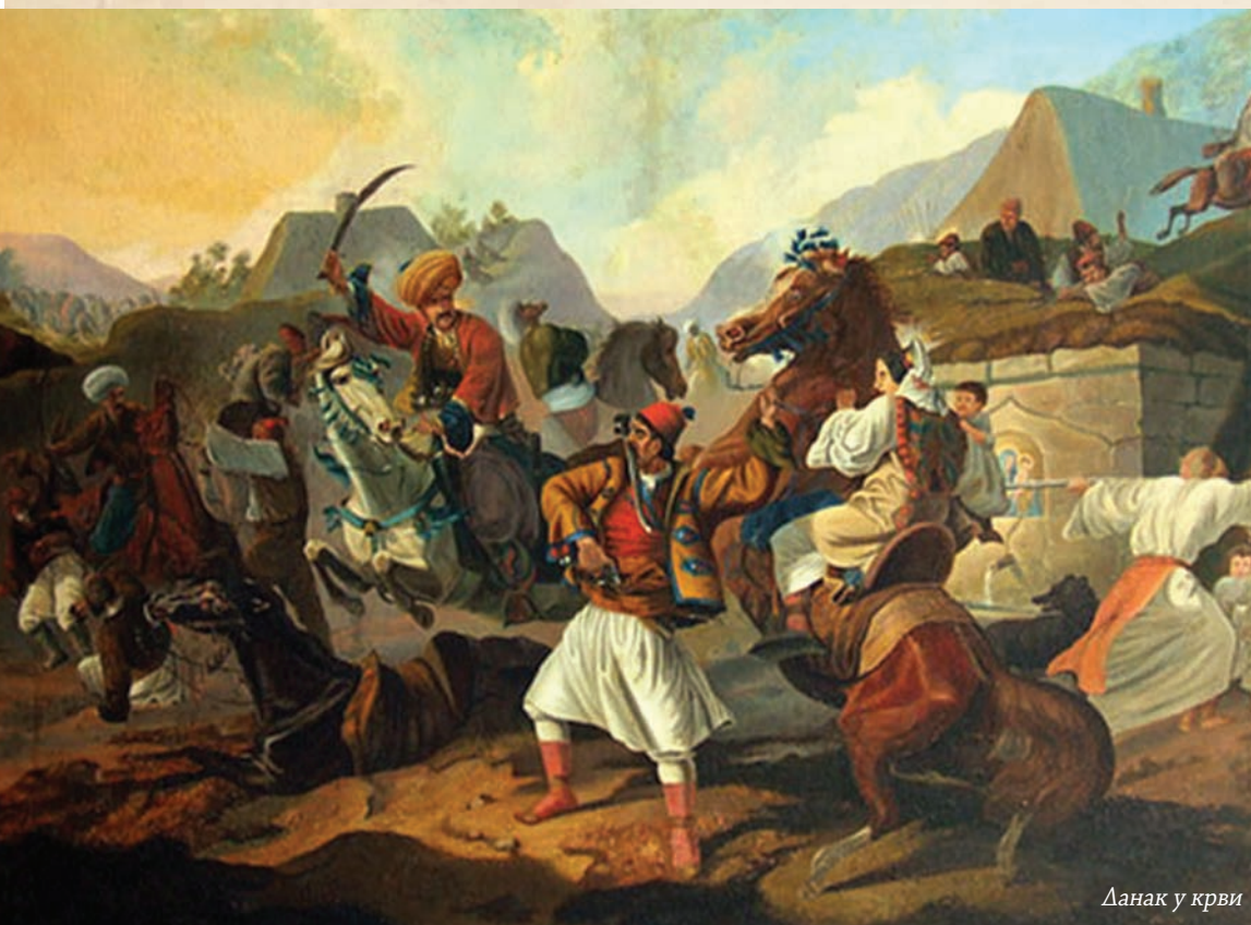
Данак у крви

Прву реакцију централних власти Отоманског царства представљао је долазак босанског везира Бећирпаше у Београд у јуну 1804. године. Присуство високог отоманског званичника само је делимично допринело ублажавању најдраматичнијих последица дахијске власти у пашалуку. Саме дахије, Аганлија, Мехмед-ага Фочичић, Мула Јусуф и Кучук Алија, убијени су од стране Срба, а уз сагласност Бећирпаше, чиме је значајно ослабила снага одметнутих јаничара и крџалија у пашалуку.