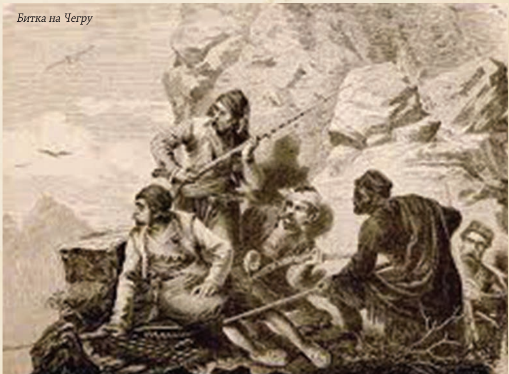
Битка на Чергу

Крај 1806. и почетак 1807. обележила су два највећа успеха српских устаника који су вишегодишњу борбу против Турака окончали ослобађањем Шапца и Београда. Ови догађаји допринели су томе да устанички прваци одбаце претходно склопљен Ичков мир, који је представљао први преговарачки успех остварен током иницијалне фазе устанка.